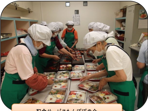
配食サービスたんぼぼの会