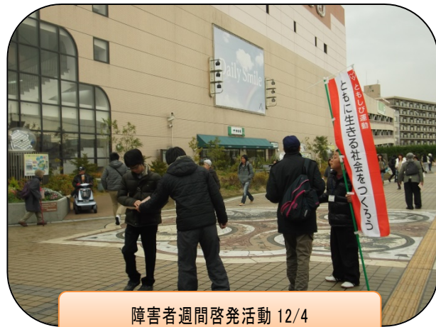
障害者週間啓発活動 12/4