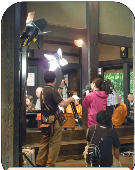
NHK おはよう日本 「旬を楽しむ 400 円レシピ」紹介 6/25