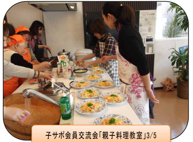
子サポ会員交流会「親子料理教室」3/5