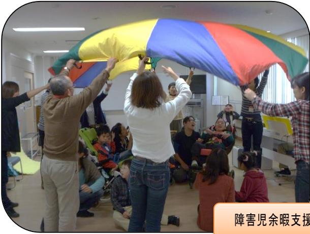
障害児余暇支援「みーとすまいる」11/10