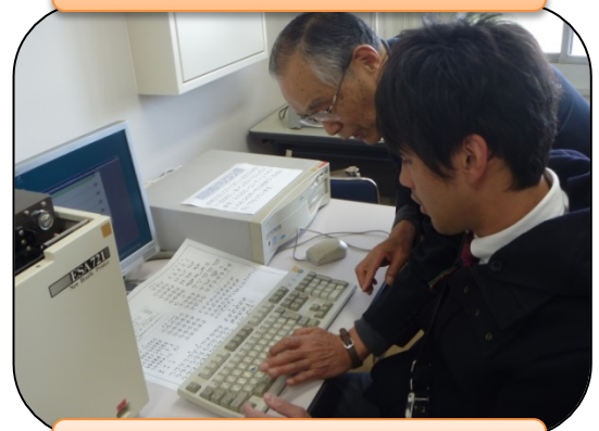
せやまるふくしまつり 12/8