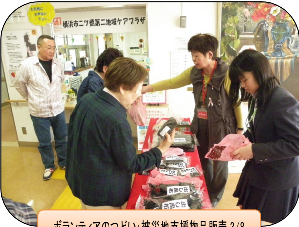
ボランティアのつどい:被災地支援物品販売 3/8