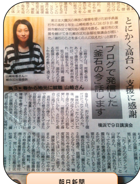
朝日新聞 「釜石の今」話します 3/7