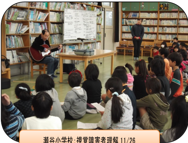
瀬谷小学校:視覚障害者理解 11/26