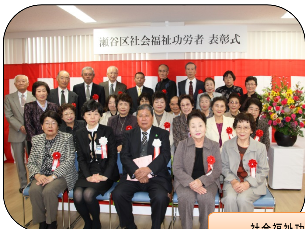
社会福祉功労者表彰式 11/13