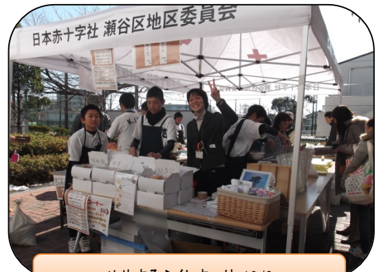
せやまるふくしまつり 12/8