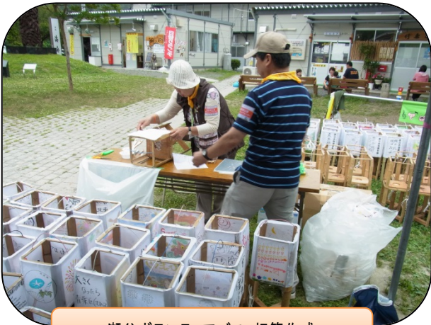
瀬谷ボランティアバス: 灯籠作成