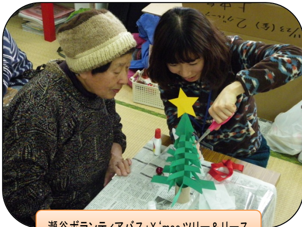
瀬谷ボランティアバス: X'mas ツリー&リース