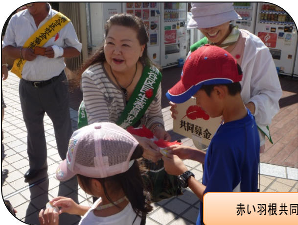
赤い羽根共同募金街頭募金 10/1