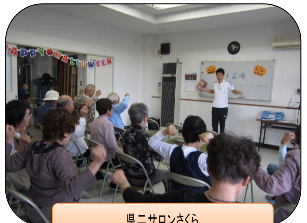
県ニサロンさくら