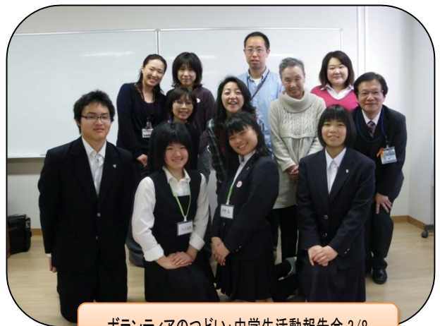
ボランティアのつどい:中学生生活動報告会 3/8