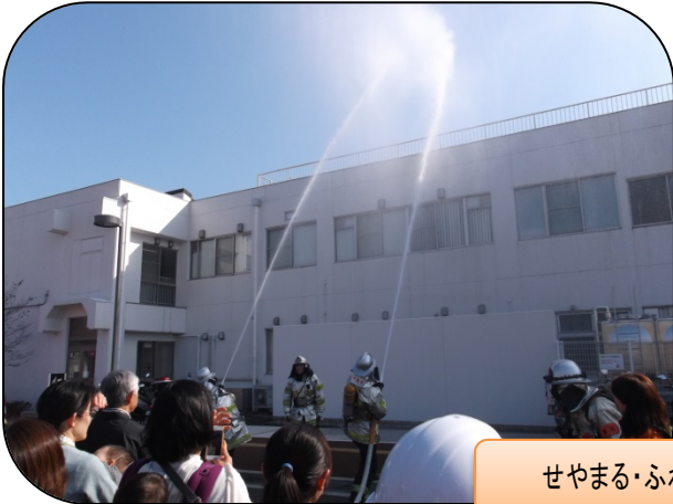
せやまる・ふれあい館消防訓練 3/5