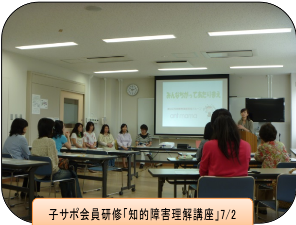
子サポ会員研修「知的障害理解講座」7/2