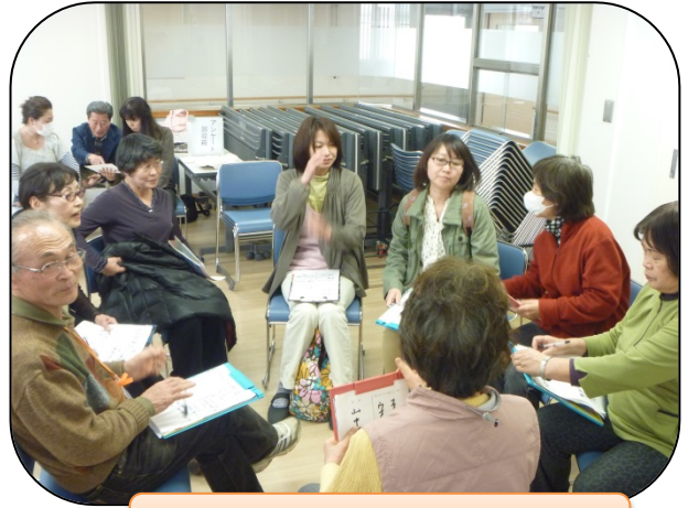
生活・介護支援サポーター養成講座 認知症支援コース