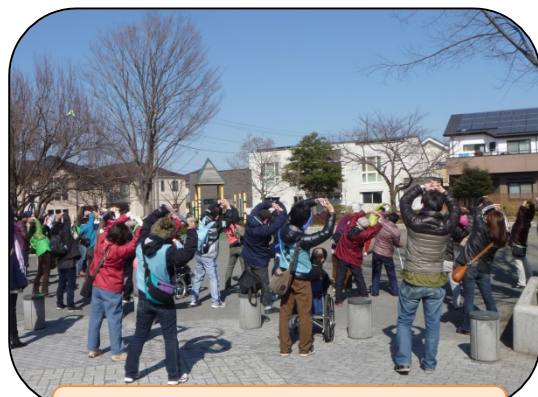
瀬谷ふくし探検ウォーク 2013 2/23