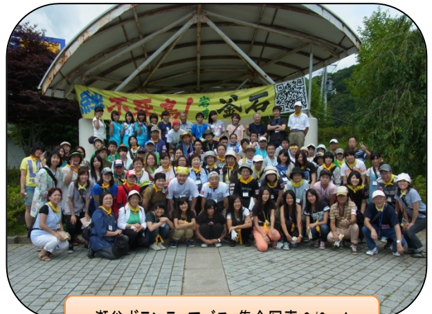
瀬谷ボランティアバス: 集合写真 8/2~4