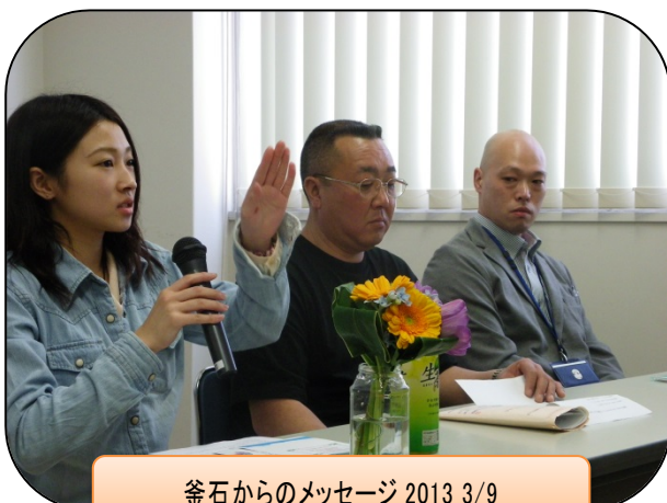
釜石からのメッセージ 2013 3/9