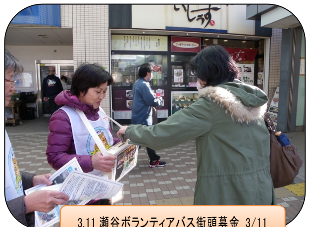
3.11 瀬谷ボランティアバス街頭募金 3/11