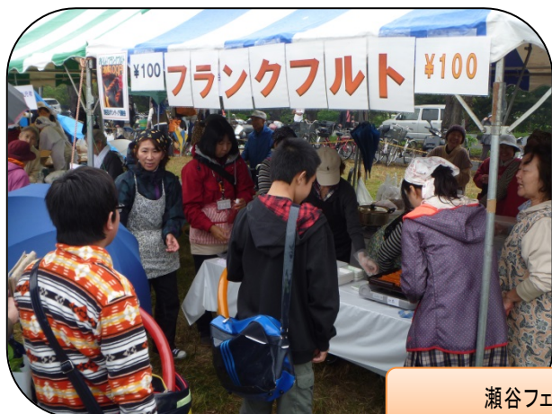
瀬谷フェスティバル 10/28