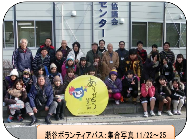
瀬谷ボランティアバス: 集合写真 11/22~25