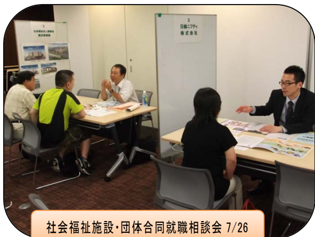
社会福祉施設・団体合同就職相談会 7/26