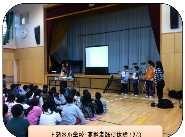
上瀬谷小学校:高齢者疑似体験 12/3