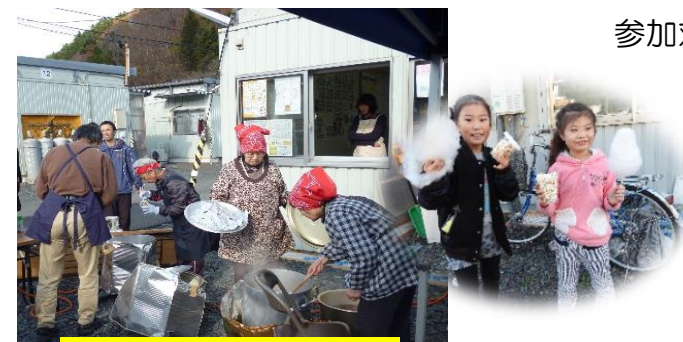
平成 27 年度活動の様子

事前説明会…7月15日(金) 18時30分~20時 「せやまる・ふれあい館」にて ※出席できない場合は参加不可となります。