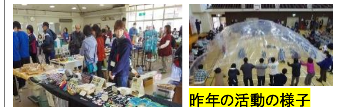
昨年の活動の様子