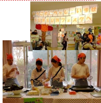
昨年度の活動の様子