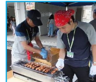
横浜名物シウマイ、牛バラ焼きかき氷など、とても好評でした♪

ある一人の女性から、被災をしてから聴覚に異変が起こり補聴器を使用しているという話を聞き、復興は進んでいるが心の傷は深いと感じました。