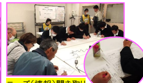
ニーズ(情報)聞き取り