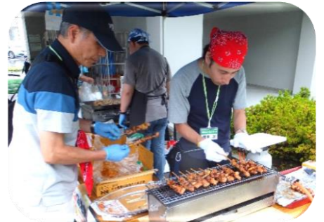
↑平成30年度の活動の様子