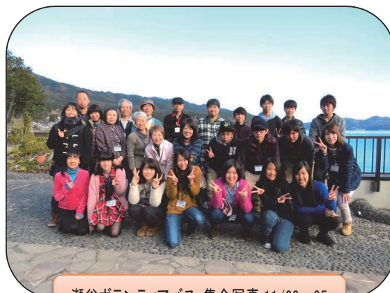
瀬谷ボランティアバス:集合写真 11/22~25