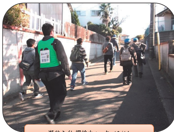
瀬谷ふくし探検ウォーク 12/14