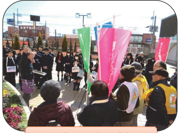
3.11 瀬谷ボランティアバス街頭募金 3/11