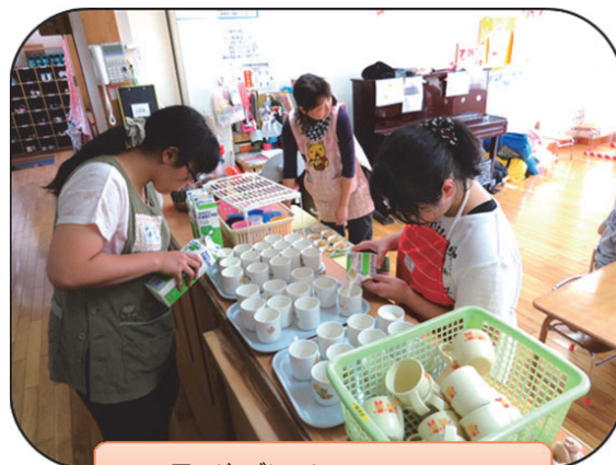
夏のジョブトライアル 7/25~8/8