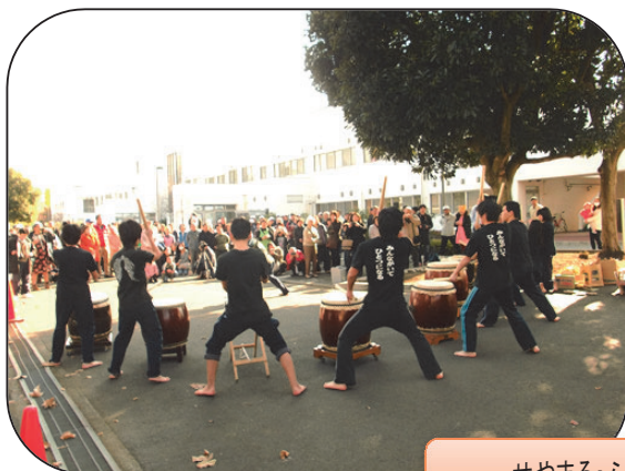
せやまる・ふれあい祭り 12/7