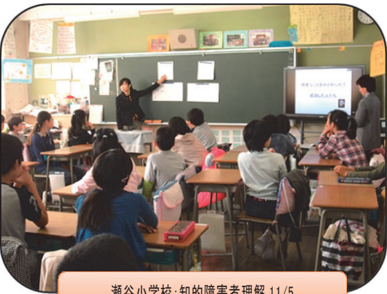
瀬谷小学校:知的障害者理解 11/5