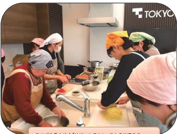
子サポ会員交流会「地域のお母さんに教わる料理教室」 3/6