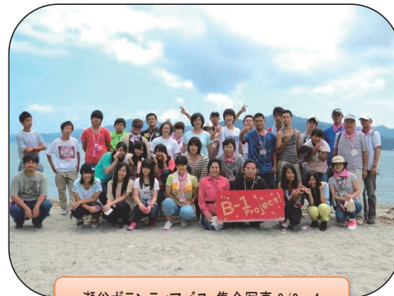
瀬谷ボランティアバス:集合写真 8/2~4