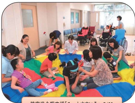
障害児余暇支援「みーとすまいる」 7/28