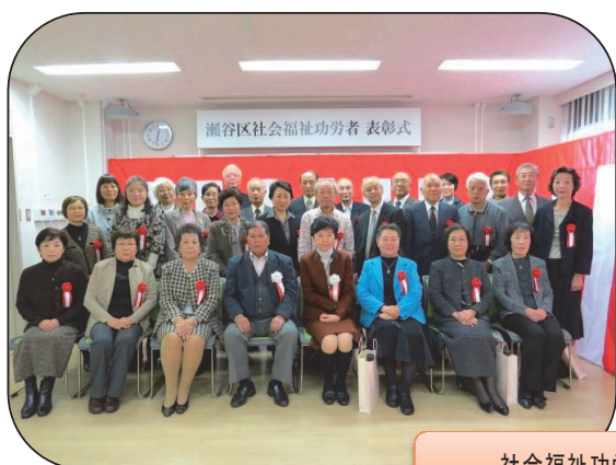
社会福祉功労者表彰式 11/11