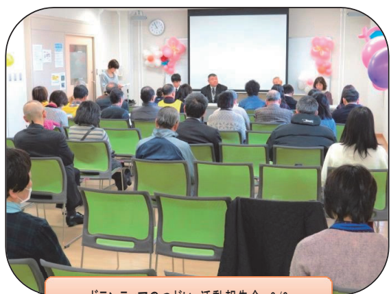
ボランティアのつどい:活動報告会 3/8