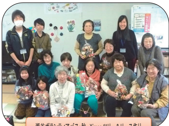
瀬谷ボランティアバス:秋 X'mas ツリー&リース作り