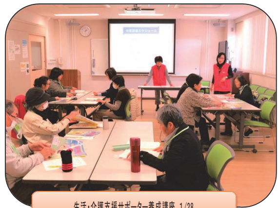
生活・介護支援サポーター養成講座 1/28