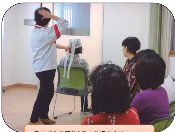
子サポ会員研修「日赤幼児安全法」 1/24