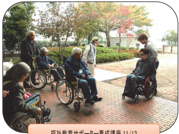
福祉教育サポーター養成講座 11/12