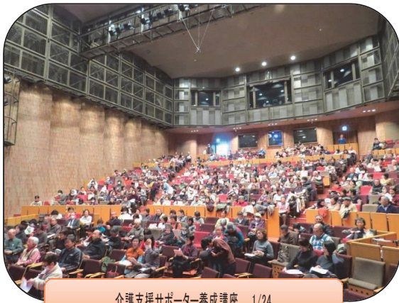
介護支援サポーター養成講座 1/24