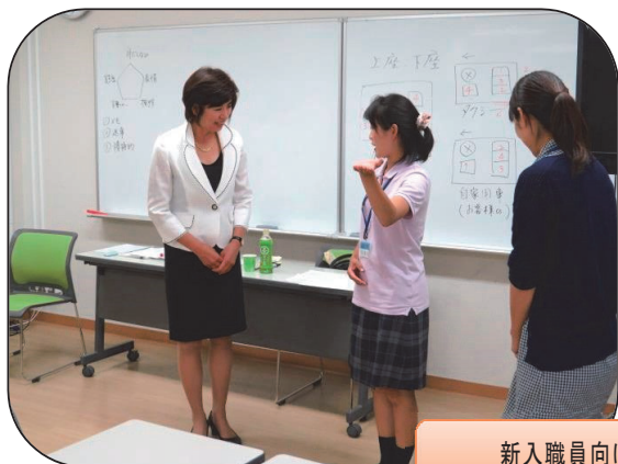
新入職員向けマナー研修 8/20