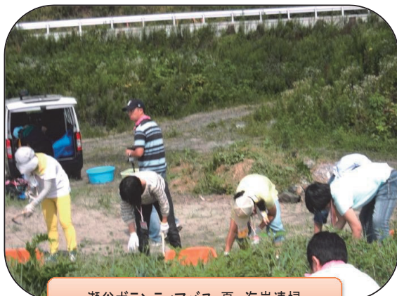
瀬谷ボランティアバス:夏 海岸清掃