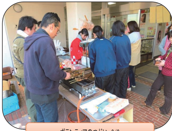
ボランティアのつどい 3/8