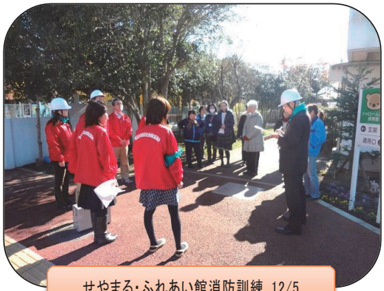
せやまる・ふれあい館消防訓練 12/5