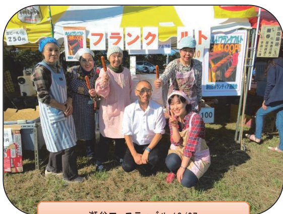
瀬谷フェスティバル 10/27