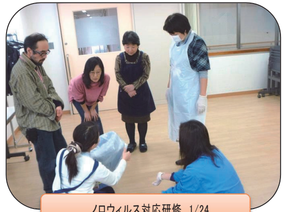
ノロウイルス対応研修 1/24