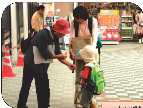
赤い羽根共同募金街頭募金 10/1