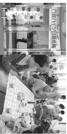
▲サロン『よってって〜』は笑顔でいっぱい!!

南瀬谷地区社協は、地域に住むみなさんに安心・安全で「南瀬谷に住んで良かった!」と言われるようなまちづくりを連合会と協働で推進しています。運営資金は、市・区社協の助成金、会費（連合会会費の1か月分）、福祉バザーの収益金等です。11のボランティア団体が参加し、赤ちゃんから高齢者まで幅広く支援しています。今年度は、ボランティア団体同士の交流と、より多くの人に情報を知ってもらう広報活動に力を入れています。