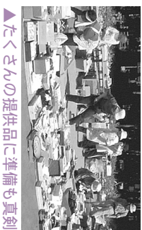
▲たくさんの方の提供品に準備も真剣