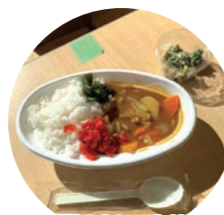
大好評のカレーとサラダ