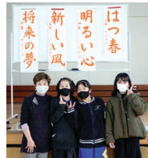
書き上げた後で講師の先生と記念撮影

瀬谷第一地区で冬休み習字教室を開催するのは、今シーズンで4回目になります。でも今年はいつもと同じではありません。三密